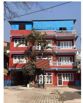
現地で運営している教育施設の様子